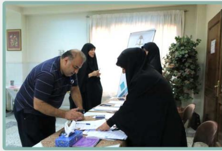
دادن برگه های رای و نظرسنجی به اولیا