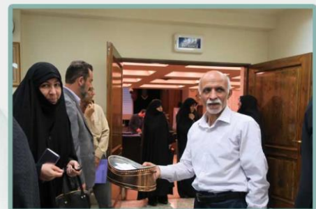
جمع آوری آراء