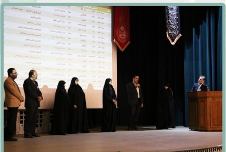
معرفی داوطلبین انجمن اولیا