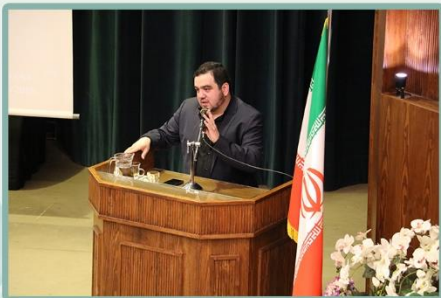
بیان نکات لازم تربیت در سیره امام سجاد (ع) توسط آقای مهدوی