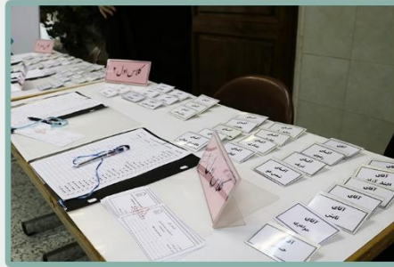
لیست حضور و غیاب و کارت های شناسایی جهت معرفی شدن پدران به سایرین