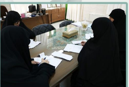
شمارش آرا در دفتر مدیریت