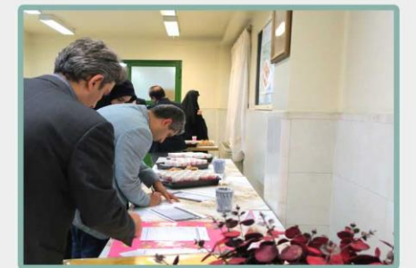
پذیرایی و اخذ رای از حضار