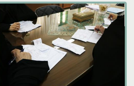
شمارش آرا در دفتر مدیریت