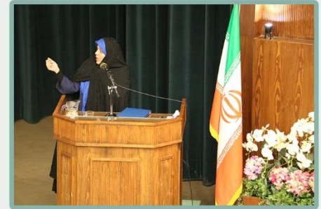
معرفی امور زبان فوق برنامه توسط خانم مجرد مسئول دپارتمان