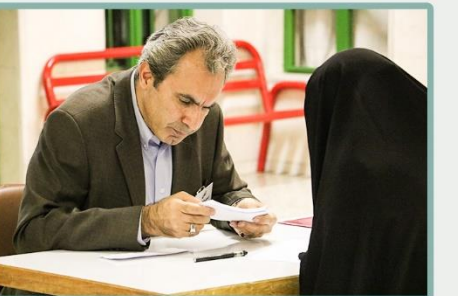
شمارش آرا توسط اعضای هیئت نظارت