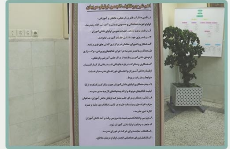
شرح وظایف اعضای انجمن در معرض دید حاضرین هنگام ورود