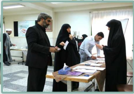
ورود اولیا محترم به جلسه