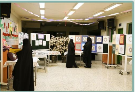
نمایشگاه آثار هنری دانش آموزان در پایگاه تابستانه