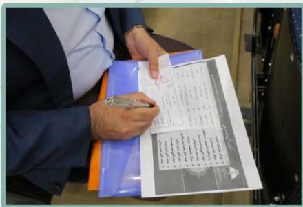
برگه رای و نظر سنجی