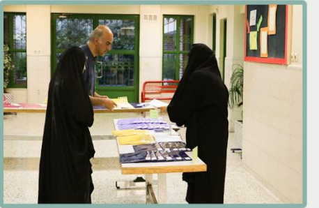
ارائه کارنامه تابستان ۹۸