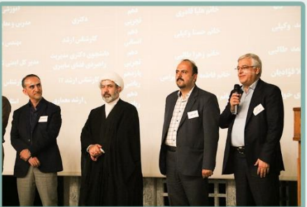
معرفی داوطلبین عضویت در انجمن