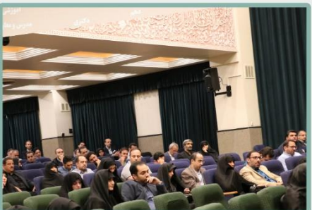
حاضرین در جلسه