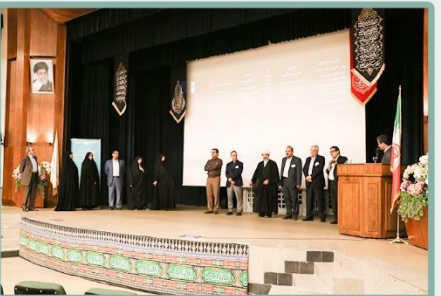
اعلام اسامی داوطلبین عضویت در انجمن اولیا مربیان