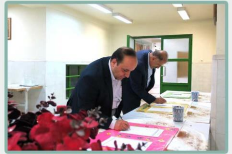
ورود اولیا محترم به جلسه