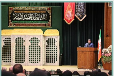
بیان نکات تربیت از منظر امام سجاد (ع) توسط جناب آقای مهدوی