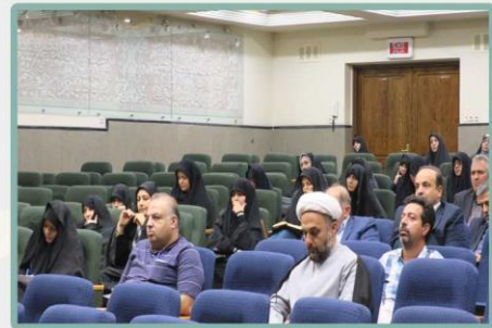
حاضرین در جلسه