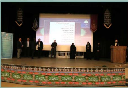
اعلام اسامی داوطلبین عضویت در انجمن اولیا مربیان