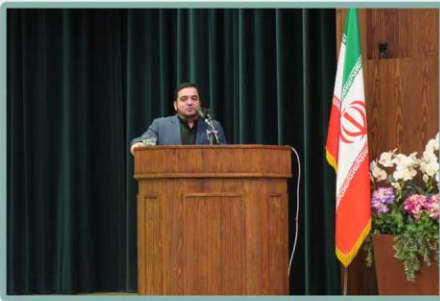
بیان نکات لازم تربیتی در سیره امام سجاد (ع) توسط آقای مهدوی