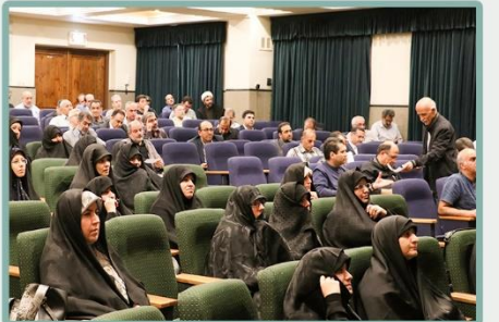
حاضرین در جلسه