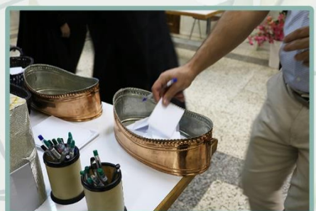
جمع آوری برگه های رأی