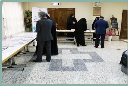
ورود اولیا محترم به جلسه