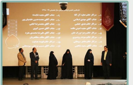
معرفی داوطلبین انجمن اولیا