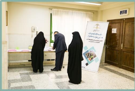
ورود اولیا محترم به جلسه