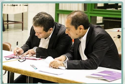
شمارش آرا توسط اعضای هیئت نظارت