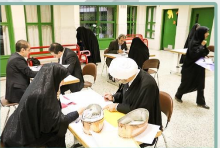
شمارش آرا توسط اعضای هیئت نظارت